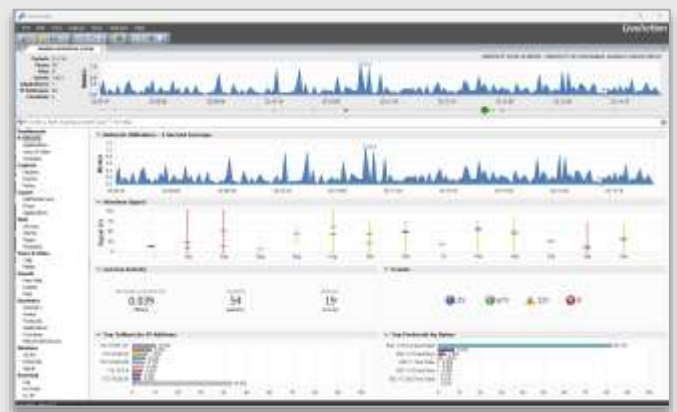
LiveWire/Omnipeekパケット解析画面